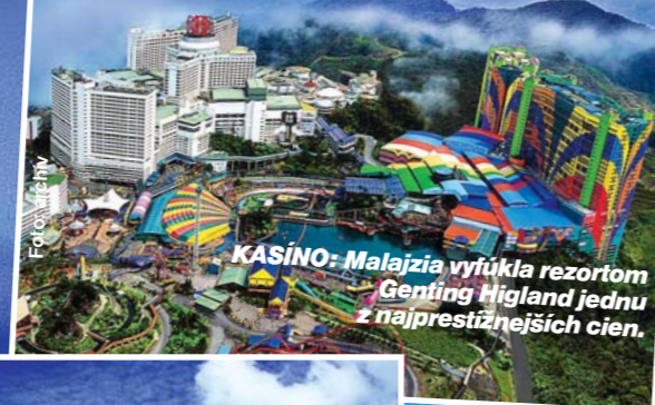
KASÍNO: Malajzia vyfúkila rezortom Genting Highland jednu z najprestížnejších cien.

Zástupcovia rajských ostrovov krajiny Maldivy prežili úspešný večer