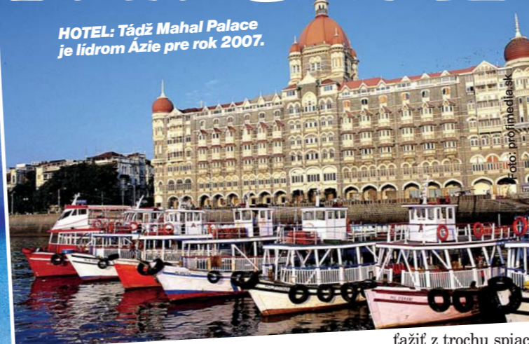
HOTEL: Tádž Mahal Palace je lídrom Ázie pre rok 2007.

WORLD TRAVEL AWARDS 2007 ÁZIA, AUSTRÁLIA INDICKÝ OCEÁN