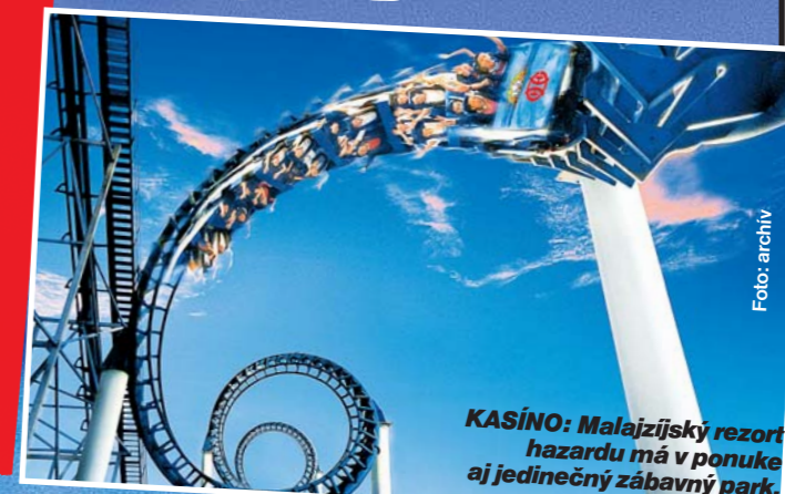
KASÍNO: Malajzijský rezort hazardu má v ponuke aj jedinečný zábavný park.

WORLD TRAVEL AWARDS 2007 ÁZIA, AUSTRÁLIA INDICKÝ OCEÁN